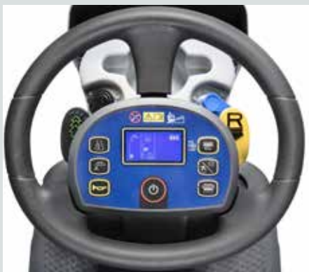
Bedieningsgemak: extreem gebruikersvriendelijk en gemakkelijk te bedienen. Bedieningspaneel met One-Touch knop en intuïtieve display, geïntegreerd in het stuur