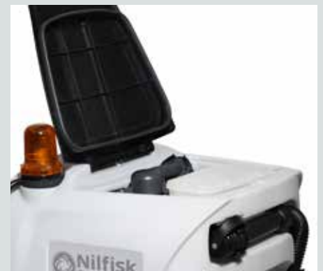
Eenvoudig te reinigen vuilwatertank met volledig te verwijderen deksel.